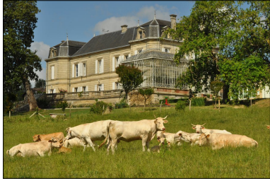
Les Blondes d'Aquitaine