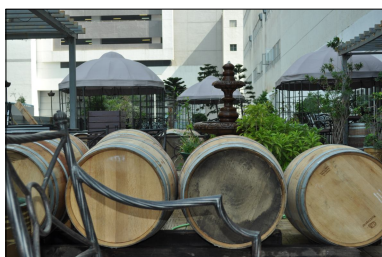
8th Estate Winery- Hong Kong

Beaucoup d'activités et beaucoup de personnes sont passées par ici cette année. Les points forts sont Vinexpo, le tournage pour Arte et la vente de raisin pour Hong Kong.