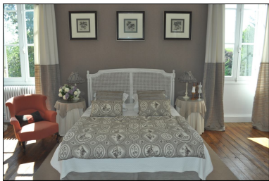
Chambre du Parc