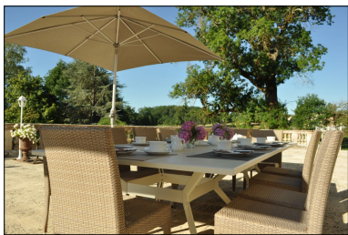
Petit déjeuner sur la terrasse