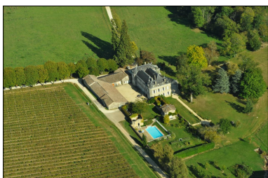
Carbonneau en ULM